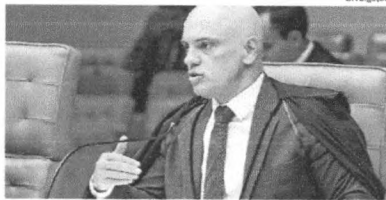
Ministro Alexandre de Moraes considera decisão da Câmara um marco

O ministro Alexandre de Moraes, do Supremo Tribunal Federal, disse ontem que a confirmação da ordem de prisão do deputado bolsonarista Daniel Silveira (PSL-RJ) nos plenários da própria Corte e da Câmara dos Deputados foi um “marco no combate ao extremismo antidemocrático”. “O incentivo a dar surras em ministros do Supremo Tribunal Federal, o incentivo a agressões contra a saúde e vida de ministros do Supremo Tribunal Federal, o incentivo à ditadura e ao AI-5 que fecha o Supremo Tribunal Federal não são críticas, são atentados contra a democracia”, disse.