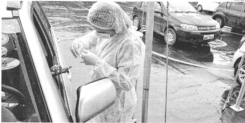
Profissional de saúde coleta sangue para fazer exame no drive thru instalado no Complexo Castelão; testagem nos mesmos moldes também é realizada no Parque do Rangedor

Capital e Interior R$ 2,00 Outros estados R$ 4,00